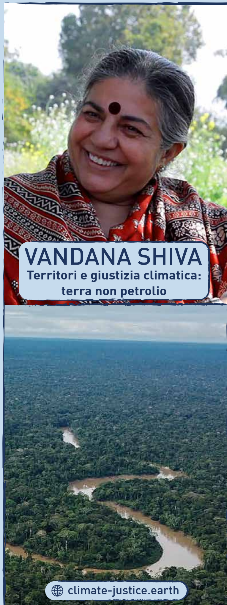
VANDANA SHIVA Territori e giustizia climatica: terra non petrolio

Dibattito | 13.30 - Conclusione prima sessione